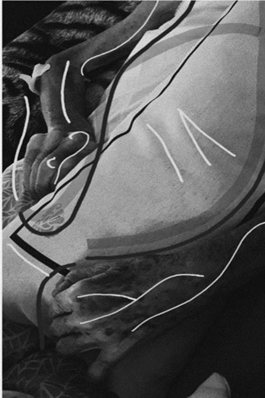
Figura 1. Fotografia com edição e intervenção digital

O Alzheimer é uma doença que provoca relações complicadas de perda em diversos níveis e em diferentes aspectos fisiológicos; uma memória fragilizada e escura é o que tenta demonstrar a figura criada pela autora deste artigo. A idosa em questão, que é o objeto de criação das figuras é a avó da autora, a idosa nesta fase da doença, sempre se agarrava aos travesseiros, momento flagrado na Figura 1. A cena transparecia uma sensação de que ela estava se agarrando àquilo de que se lembrava, para que ela mesma não fosse esquecida.