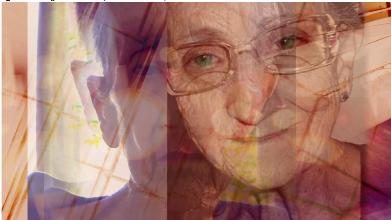
Figura 4. Fotografia com edição de Photoshop