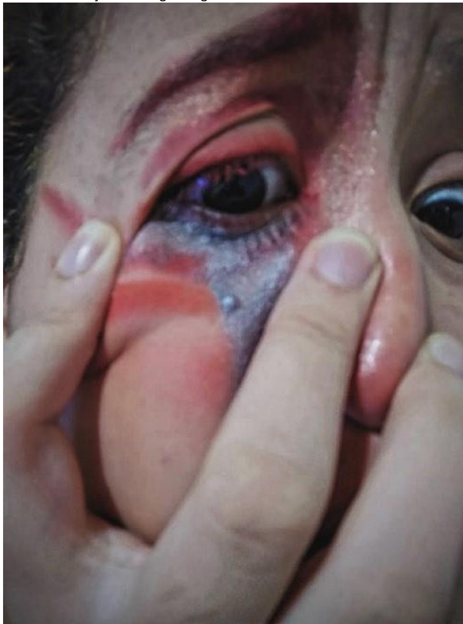
Figura 2. Autorretrato com edição de imagem digital

A fotografia tenta despertar a atenção de quem a está observando, olhar as manchas e encontrar os ossos expostos, os machucados abertos, as mãos agarrando com falta de firmeza o travesseiro. Foi feita uma intervenção com riscos digitais nessa fotografia, pequenas linhas da vida. Estas linhas, de um significado mais estético, procuram ressaltar aquilo que o espectador precisa ver: as marcas abjetas do Alzheimer, a magreza, a ferida, as manchas, o agarrar-se a algo.