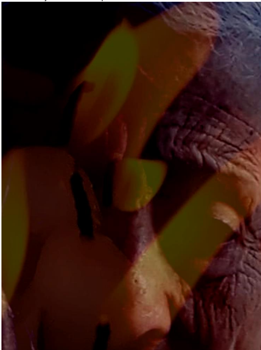
Figura 3. Fotografia com edição de Photoshop