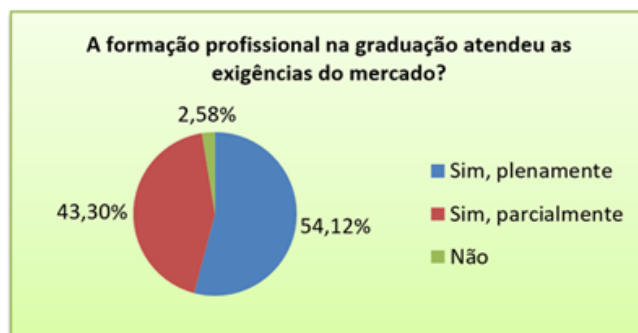
Gráfico 1. Distribuição da formação profissional quanto à exigência do mercado Fonte: Unoeste (2016)

Um dos destaques é a relação da formação recebida com as exigências do mercado de trabalho como mostrado no Gráfico 1 , podemos inferir que, aproximadamente 54,12% dos nossos egressos ressaltam que a formação recebida na Unoeste atende plenamente as necessidades do mercado; 43,30% que atende parcialmente essa necessidade; e somente 2,58% que não atende.